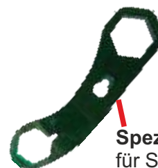
Spezial-Schlüssel für Sonden und Filtersieb

Während dem Ein- und Ausschrauben der Sonde ist es einfacher den elektrischen Anschluss (Bajonett-Verschluss) von der Steuerbox abzuschrauben.