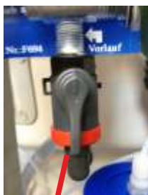
Kugelhahn ist geöffnet